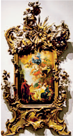
Entwurf des Hauptaltars von J. N. Schöpf aus dem Bayerischen Nationalmuseum München.

Der 1762 fertiggestellte Hochaltar ist ein hervorragendes Beispiel für das Konzept eines Gesamtkunstwerkes, bei dem durch das Zusammenspiel von Malerei, Plastik und Architektur eine ganzheitliche Bildwirkung angestrebt wurde. Die gemalte Himmelfahrt Mariens setzt sich in den bekrönten Darstellungen von Christus und Gottvater fort, die Maria erwarten und in Empfang nehmen.