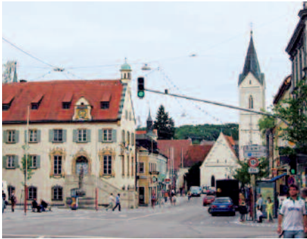
Blick auf die Hauptstraße mit Altem Rathaus und Leonhardi-Kirche.

Nur wenige Orte in Bayern stehen in so enger Beziehung zum Hause Wittelsbach wie Fürstenfeldbruck. Der Name ist zusammengesetzt aus Fürstenfeld und Bruck. Dies verweist auf eine für den Salzhandel bedeutsame Brücke über die Amper, die zu den Besitztümern der Wittelsbacher gehörte (Feld des Fürsten) und schon früh (1306) einen Marktflücken entstehen ließ.